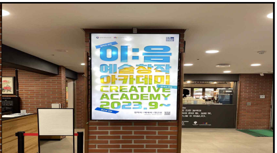
1층 모니터 2EA