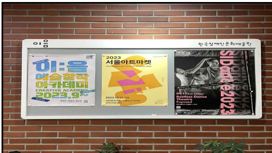
1층 게시판 2EA