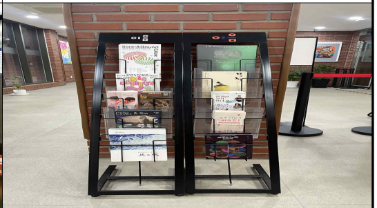
1층 홍보물 게시대